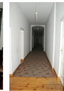
Pomieszczenia biurowe II piętro