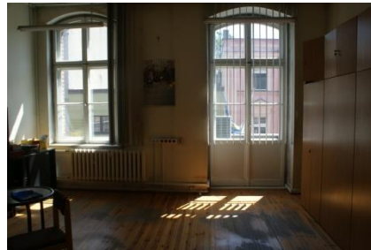
pomieszczenie biurowe I piętro

Niezależnie od czynszu Najemca będzie ponosił opłaty za dostawę: energii elektrycznej, energii cieplnej, wody zimnej, odprowadzania ścieków, opłaty z tytułu wywozu nieczystości stałych.