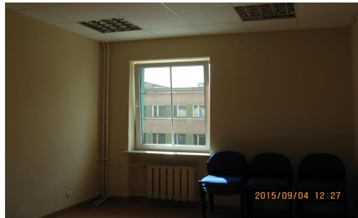
Pomieszczenia do wynajmu II piętro