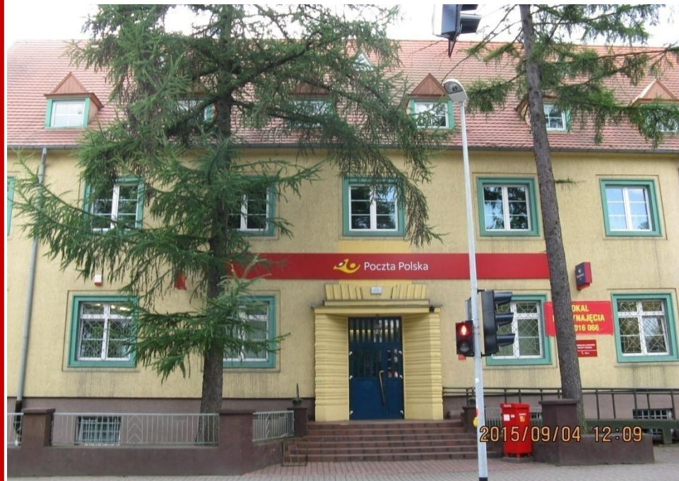
Zdjęcie budynku w Rzepinie

Miejsce: Poczta Polska S.A. ul. Głogowska 17, 90-943 Poznań