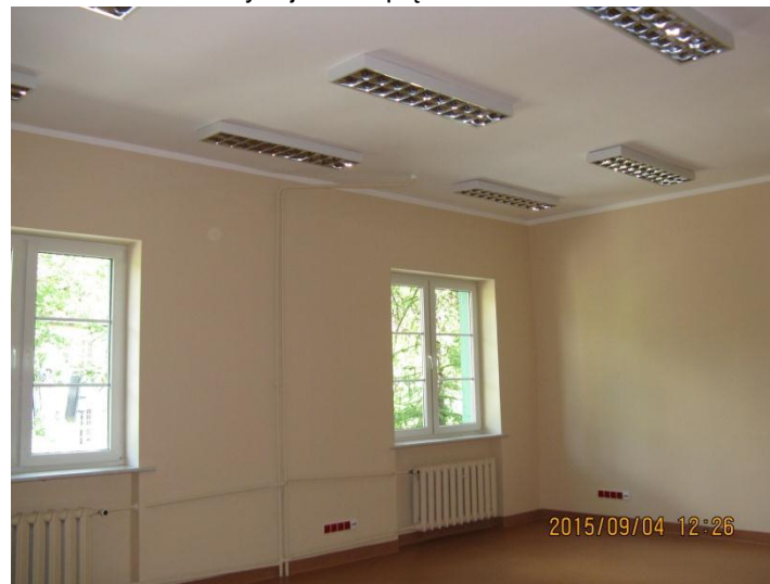
Pomieszczenia do wynajmu – I piętro

Niezależnie od czynszu Najemca będzie ponosił opłaty za dostawę: energii elektrycznej, energii cieplnej, wody zimnej, odprowadzania ścieków, opłat z tytułu wywozu nieczystości stałych.