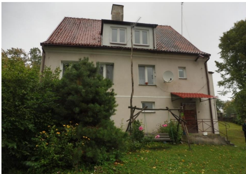
Okna na I piętrze należą do lokalu mieszkalnego