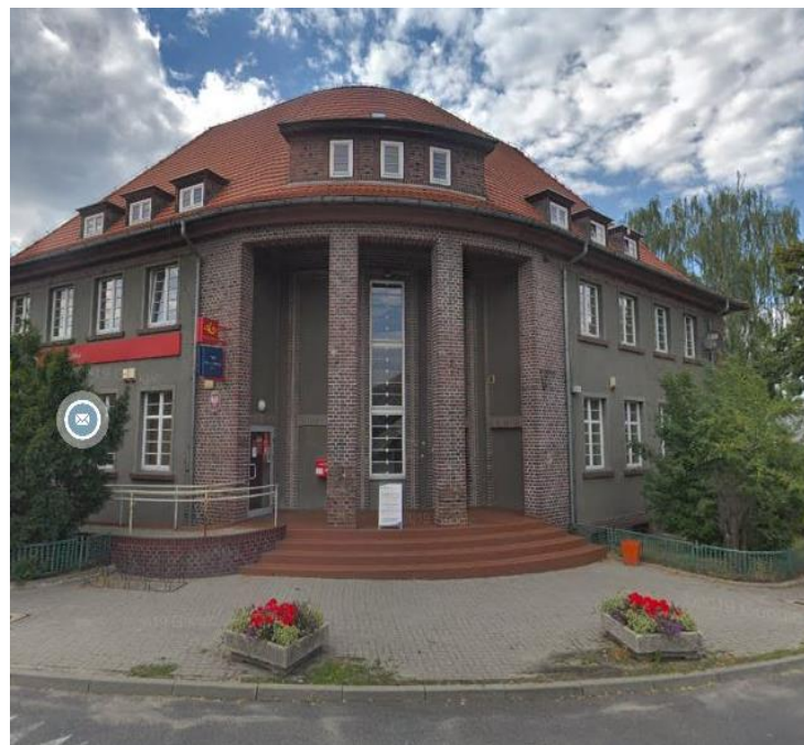
Budynek, w którym znajduje się lokal mieszkalny – II piętro

Słownie: dwa tysiące pięćset dwadzieścia cztery zł 08/100