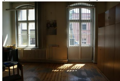
pomieszczenie biurowe I piętro

Niezależnie od czynszu Najemca będzie ponosił opłaty za dostawę: energii elektrycznej, energii cieplnej, zimnej wody, odprowadzania ścieków, opłaty z tytułu wywozu nieczystości stałych.